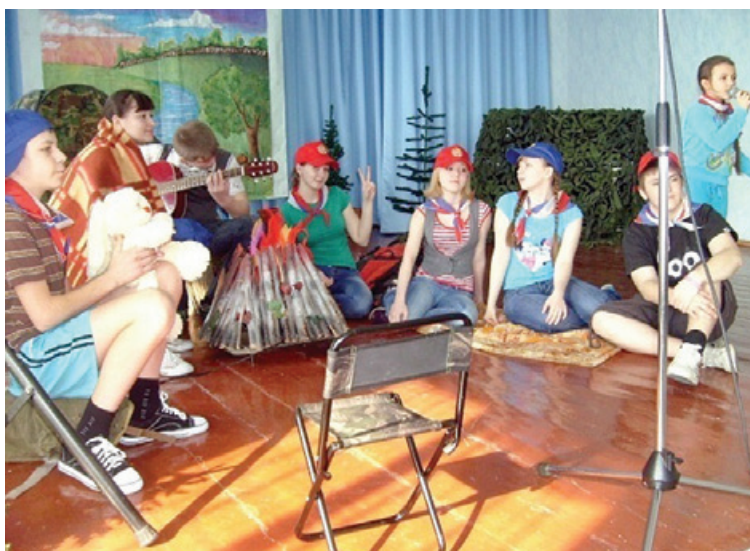
Рис. 2. День туризма (защита проектов)