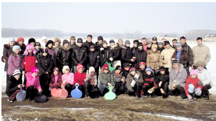
Рис. 3. День спасателя (спортивно-массовое мероприятие)