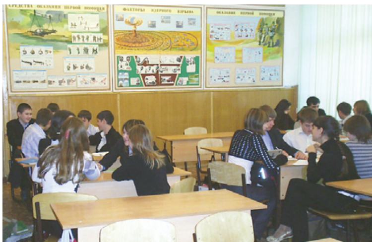
Рис. 1. Международный день охраны озонового слоя (диспут)