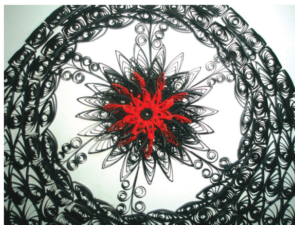
Рис. 5. Отдельный элемент — готическая роза