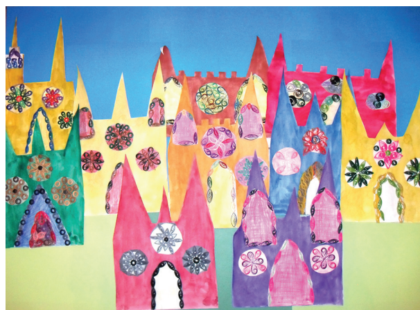
Рис. 6. Коллективная работа «Готический город»