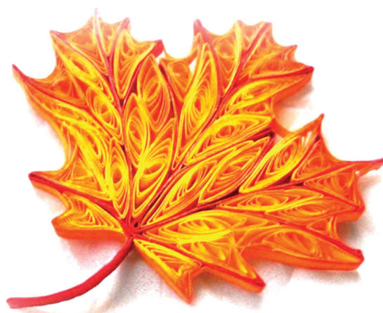
Рис. 1. Отдельный элемент — лист

Наряду с освоением базовых элементов (свободная спираль, плотная спираль, открытая спираль, капля, лепесток, глаз, лист, полукруг, стрела, изогнутый полукруг, треугольник, квадрат, «утиная лапка», V-образный завиток, завиток «сердце») в программе предусмотрено выполнение отдельных элементов — цветы, листья, насекомые, бабочки, снежинки, деревья, фигурки людей, геометрический и растительный орнамент в полосе, круге, квадрате, ромбе. Отличительной особенностью данной программы является завершение каждого блока коллективной работой. Сначала из отдельных элементов ученики собирают плоскостную композицию, затем из этих элементов создают панно, например «Сказочный лес», «Цветочная палитра», «Ах, волшебница зима...», «Готический город», «Мезенские мотивы», «Хоровод» (рис. 1, 3, 5, 6). Заключительными, самыми трудоемкими и сложными по выполнению могут стать объемно-пространственные композиции — мобили (рис. 2, 4) [10].