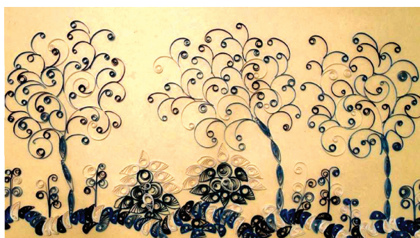
Рис. 3. Коллективная работа «Ах, волшебница зима...»