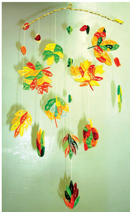
Рис. 4. Коллективная работа «Листопад»