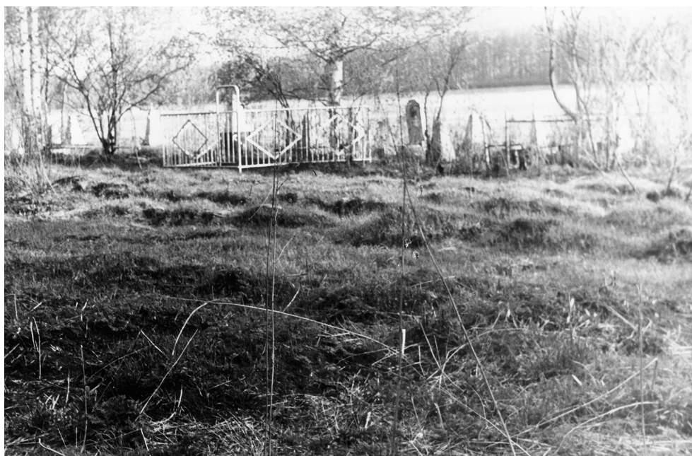
Рис. 3. Вид кладбища спецгоспиталей № 3779 и 5882. УАССР, г. Глазов (21 мая 1994 г.)