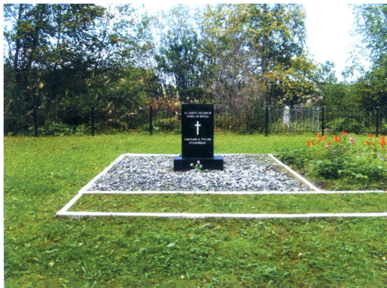
Рис. 4. Современный вид кладбища спецгоспиталей № 3779 и 5882. УР, г. Глазов

Результаты исследования. В настоящее время установлено, что в 1942—1948 гг. на территории Удмуртии функционировало пять лагерей для военнопленных. Это лагеря № 75, 155, 267, 371 и 510 ГУПВИ НКВД (МВД) СССР. Лагеря № 75 и 371 имели по четыре лагерных отделения, остальные лагеря отделений не имели. Начало формирования лагерной системы для иностранных военнопленных относится к 1942 г., последний из лагерей был закрыт в августе 1948 г. В составе лагерного контингента были военнопленные из состава венгерской, германской, итальянской, румынской и японской армий, а также гражданские лица немецкой национальности, интернированные из стран Восточной Европы.