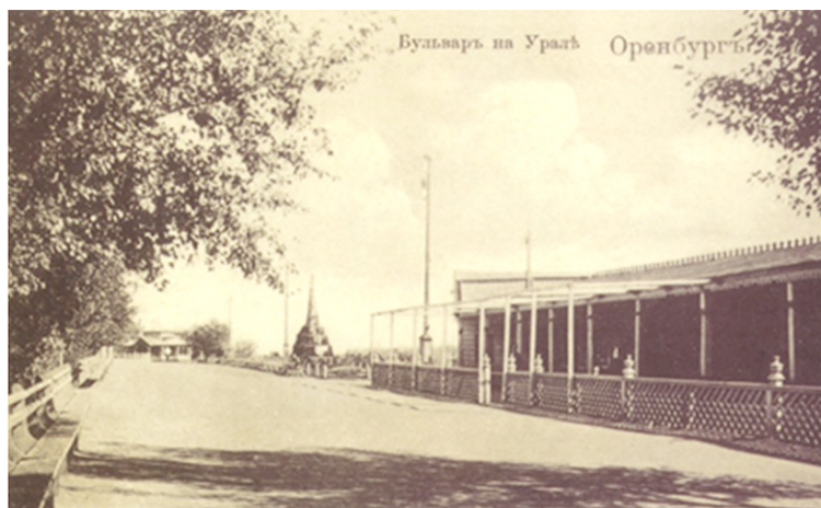
Рис. 5. Вокзал Белова. На фото видны деревянные пристройки к центральной каменной части постройки. На дальнем плане — фонтан

и развлекательные заведения. Благодаря планам размещения этих заведений на Набережной улице можно определить не только расположение вокзала Белова, но его размер и конфигурацию. Так, на выкопировке из плана г. Оренбурга с обозначением места, «проектируемого господином Чариновым под постройку деревянного павильона для синематографа» (лит. Б), можно увидеть вокзал Белова (рис. 6).