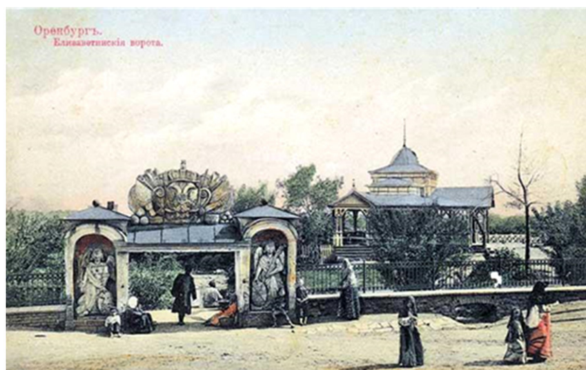
Рис. 1. Елизаветинские ворота, на втором плане деревянный павильон Белова для прохладительных напитков

В 1857 г., при правлении генерал-губернатора Александра Андреевича Катенина, на набережную с Александрплаца была перенесена Александровская колонна, которую установили точно по центральной оси улицы Николаевской (на современном месте памятника Валерию Чкалову). Сюда же с основания Водяной улицы были перенесены въездные ворота, которые установили над спуском к Уралу. Таким образом, на Набережной площади появились Водяные (Елизаветинские) ворота. Окончательно архитектурный ансамбль набережной реки Урал сформировался в 1868 г. «благодаря постройке пятиэтажного Н-образного здания Второго кадетского корпуса, уравнивающего по высоте 31-метровую колокольню барочного Преображенского собора» [20, с. 44]. Набережная площадь по периметру была огорожена металлической декоративной решеткой на каменном фундаменте, что хорошо видно на фото с Елизаветинскими воротами (рис. 1).