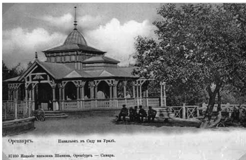
Рис. 4. Деревянный павильон Белова

Архивная фотография (рис. 4) дает возможность представить это интересное и сложное по планировке строение, которое своими резными деревянными элементами напоминает русскую народную архитектуру, в сочетании со сложной конструкцией мансарды и многоступенчатой крыши. Столбы, располагающиеся по периметру постройки, являются конструктивными и декоративными элементами. Одновременно их геометрическое переплетение над входами на террасу создает ажурный орнаментальный мотив, визуально облегчающий и украшающий строение. Геометрическая конструкция крыши сочетается с центральным пластичным куполом, который венчает шпиль. Строение по своим пропорциям и декоративному решению соответствовало стилю модерн и являлось украшением Набережной улицы. Помимо эстетической значимости павильон был еще и удобен для посетителей, поскольку в нем можно было расположиться на террасе в тени на свежем воздухе.