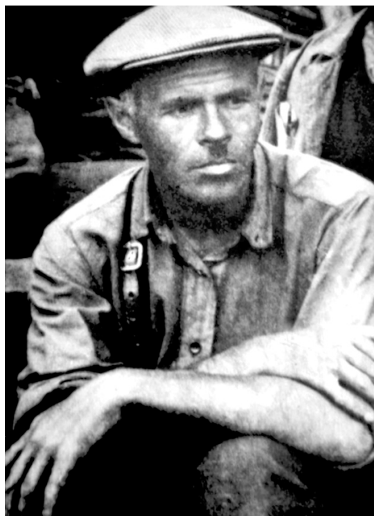
Рис. 1. Константин Владимирович Сальников (1900—1966)

Константин Владимирович Сальников (1900—1966) — без преувеличения легендарная фигура в южноуральской археологии (рис. 1). О. Н. Бадер отмечал, что «современная археология Южного Урала эпохи неолита, бронзы и раннего железа создана преимущественно К. В. Сальниковым» [1, с. 7]. Н. Б. Виноградов называет К. В. Сальникова «отцом археологии Южного Урала» [5, с. 79]. Ученым исследовано множество археологических памятников, в том числе ставших эпонимными, выделены и обоснованы ряд культур бронзового и раннего железного века, заложены основы их хронологии и периодизации.