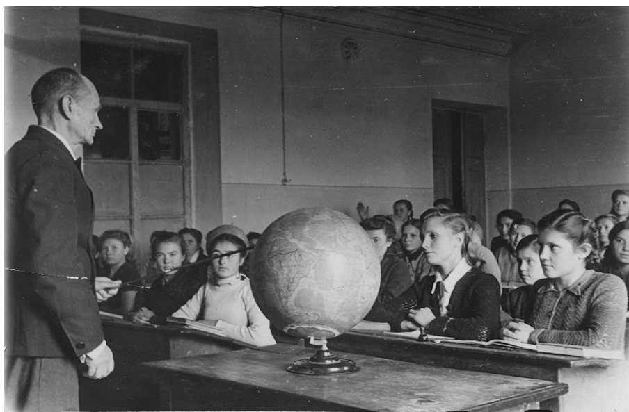
Рис. 5. Урок географии