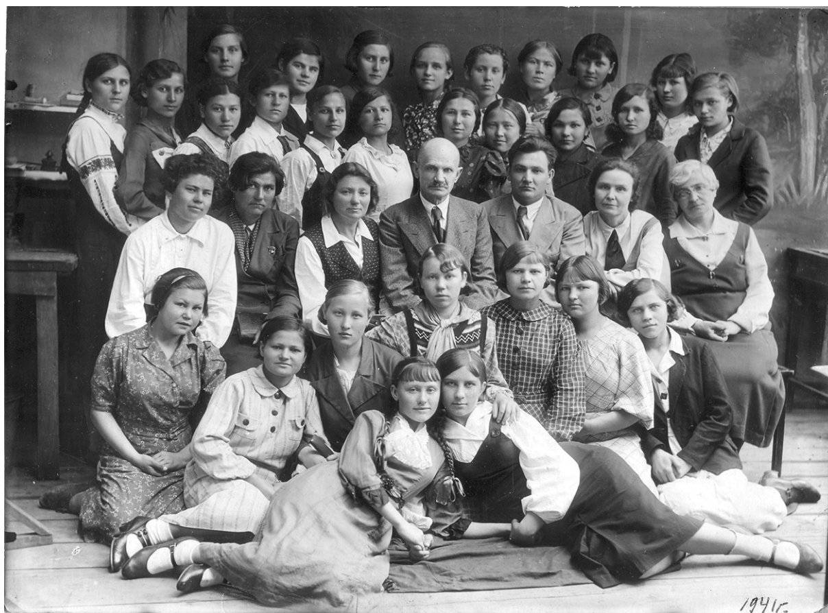
Рис. 6. Выпуск 1941 года