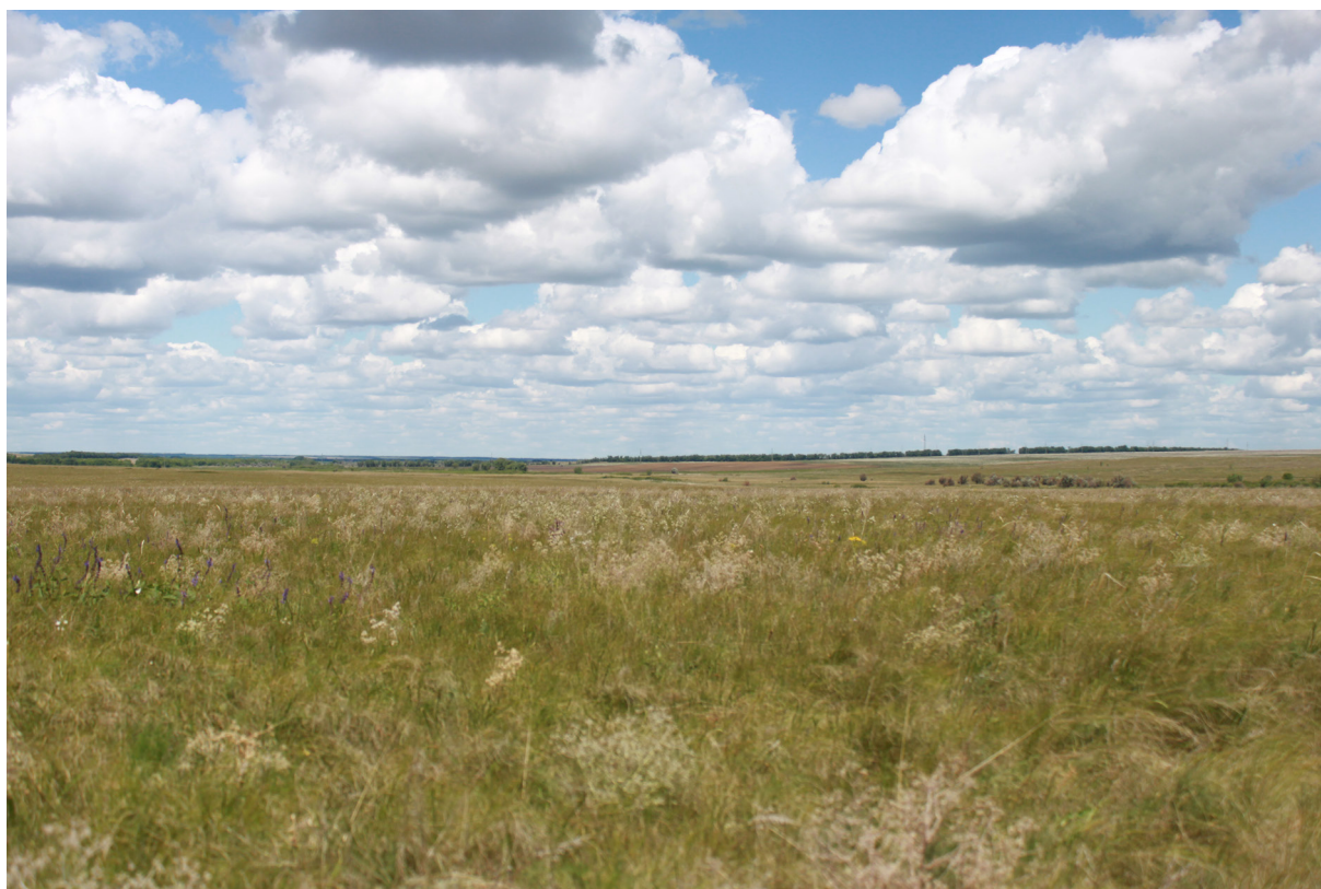
Рис. 2. Ландшафт ПП «Участок типчаково-ковыльной целинной степи»

Исследуемая ООПТ является типичной сыртовой балкой и относится к подзоне типчаково-ковыльных степей Заволжско-Уральской степной области [22]. Почвенный покров сложен преимущественно темно-каштановыми почвами, местами засоленными. В центральной части памятника природы расположен пруд [2; 23]. Характерная растительность для ООПТ — сухие типчаково-ковыльные и разнотравно-типчаково-ковыльные степи, в которых главную роль играют Festuca valesiaca Schleich. ex Gaudin s. str., Stipa capillata L. и S. lessingiana Trin. et Rupr. (рис. 2). Кроме того, в сухой степи выражена мозаичная растительность, связанная с солонцовыми почвенными комплексами, где можно увидеть такие галофиты, как Kochia prostrata (L.) Schrad., Atriplex oblongifolia Waldst. et Kit. На пологих склонах представлены ассоциации кустарников. Наиболее распространенные кустарники — Amygdalus nana L., Caragana frutex (L.) K. Koch., Spiraea crenata L. [19; 31].