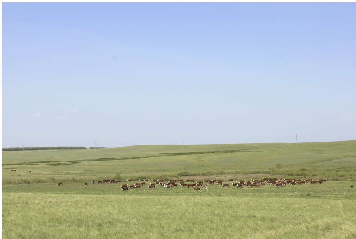
Рис. 3. Выпас скота на ООПТ «Участок типчаково-ковыльной целинной степи»

Ценоморфный анализ позволил разделить все сосудистые растения исследуемого участка на 13 групп по их принадлежности к конкретному типу растительности, или по экологическому оптимуму в биотопе [18]. В результате анализа было выявлено преобладание истинно степных растений — степантов (72 вида, или 28%). Типичными представителями являются Allium flavescens Besser, Palimbia turgaica Lipsky, Artemisia austriaca Jacq. и др. Второе место занимают представители лугового разнотравья — пратанты , их 52 вида (20%): Lathyrus tuberosus L., Geranium collinum Stephan ex Willd., Plantago maxima Jacq. и др. Наличие в центре исследуемой территории временного водоема объясняет значительное количество палюдантов (23 вида; 9%). Среди них можно назвать Typha angustifolia L., Sparganium erectum Wahlenb., Carex riparia Curtis и др. Сорные растения, или рудеранты , насчитывают 32 вида (13%). Чаще всего их можно встретить на нарушенных местах: вдоль степных дорог, на сенокосных участках и вблизи водоема, где пасется крупный рогатый скот (рис. 3).