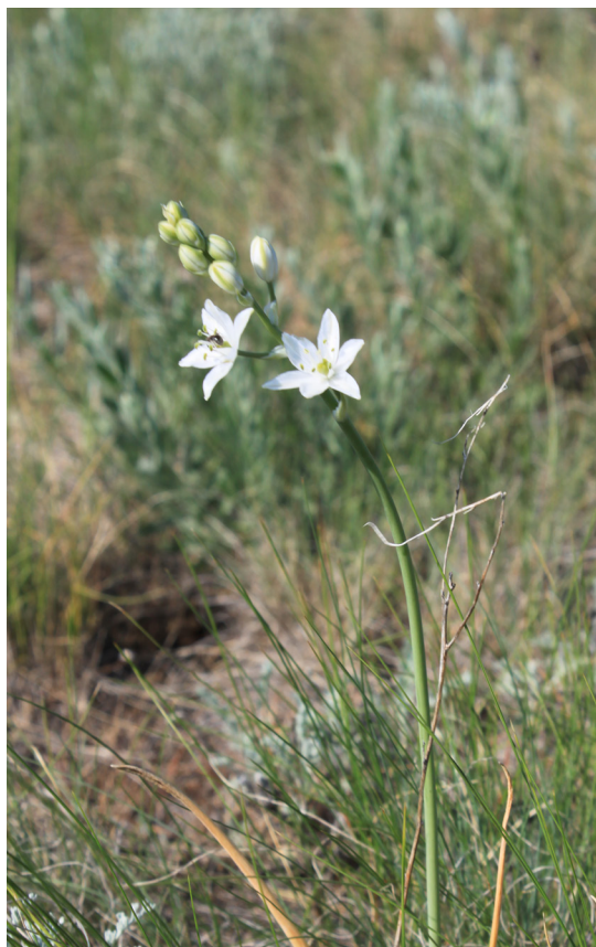
Рис. 4. Ornithogalum fischerianum

21. Pastinaca clausii (Ledeb.) Pimenov — причерноморско-казахстанский вид. 51°59'31.6" с.ш., 51°59'38.0" в.д. Сухая типчаково-ковыльная степь, на засоленной почве. 15.05.2019. Популяция насчитывает до 100 особей.