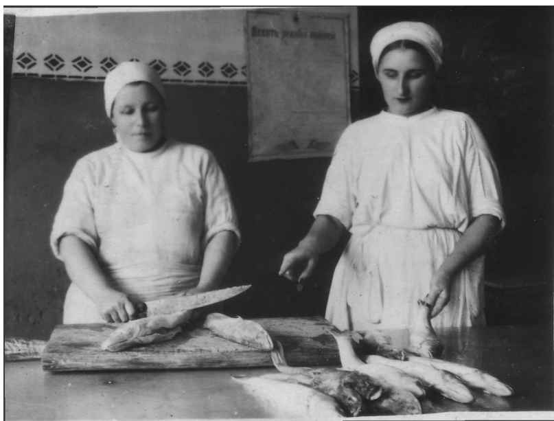
Рис. 3. На кухне эвакуогоспиталя № 4409. Март 1944 г.

Уже с 1941 г. каждый эвакуогоспиталь имел свое подсобное хозяйство, забота о котором тоже лежала на плечах начальника госпиталя. Подсобное хозяйство должно было обеспечить потребности госпиталя в продуктах питания. В посевную кампанию ежемесячно представлялись отчеты о том, сколько всего посеяно и посажено относительно плана. Высаживались зерновые и подсолнечник, картофель, овощи, бахчевые культуры. Строго учитывались цифры заготовки продуктов на зиму. Из справки о работе госпиталя № 4409 (август 1942 г.): подсобное хозяйство составляют «6 дойных коров, 23 свиньи; (высажено) по 80—90 кг картофеля, 10 тыс. корней капусты, 10 тыс. корней помидоров, огурцов и 3,5 га бахчей. Овес убран. ...Бахчи хороши. Овощи, помидоры, капуста ввиду