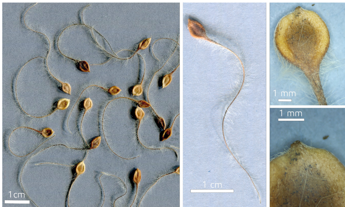
Рис. 2. Фотографии семян Clematis integrifolia

Плод C. integrifolia представляет собой многоорешек. Орешек округлый, плоский, с утолщенным ободком коричневатого-желтого или бурого цвета, покрыт волосками с длинным перисто-волосистым стилодием (носиком-летучкой) (рис. 2). Длина семян без учета стилодия изменялась в интервале 4,95—7,98 мм, ширина — в интервале 2,76—5,13 мм. Достоверных различий этих показателей в зависимости от года сбора семян и окраса цветков не прослеживается.