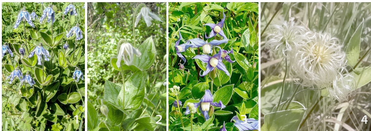
Рис. 1. Clematis integrifolia : 1 — внешний вид, 2 — цветки формы Alba, 3 — цветки, 4 — плоды

В программе JMicro Vision проводили измерение длины и ширины семян. Для этого полученные на сканере Epson Perfection V370 Photo изображения семян открывали в программе и проводили калибровку путем ввода разрешения изображения (2400 dpi). При помощи инструмента 1D Measurement проводили измерения длины и ширины, точность измерения составила 6 мкм [20; 21].